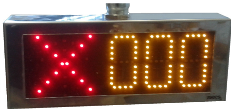
Ilustración de tres dígitos. La referencia incluye 2 + flecha aspa.